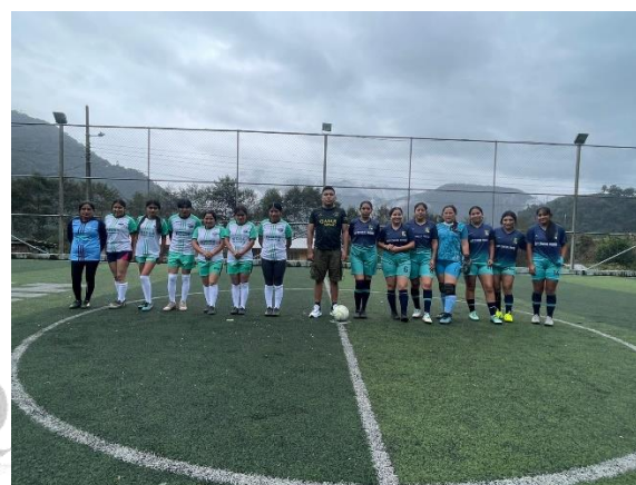
Servicio de arbitraje de encuentros deportivos