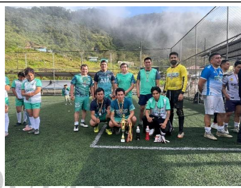
Medallas (oro, plata y bronce) de cada categoría.